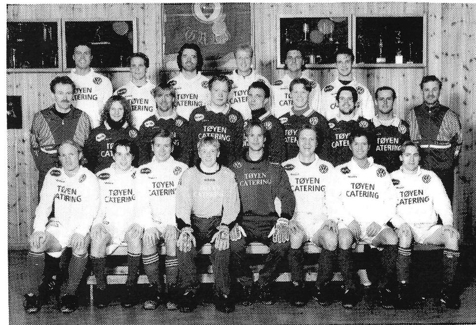
Greis A-lagsstall i fotball 1997. Mange av fjorårets spillere har lagt opp eller gått til andre klubber, så her er mange nye ansikter.

GREI-NYTT, medlemsblad for Sportsforeningen Grei.