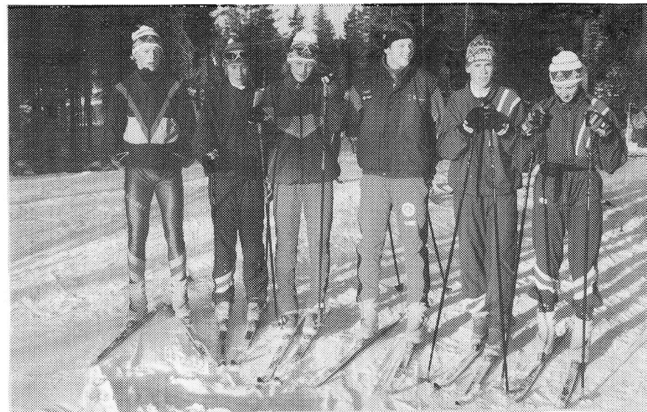
Utøvere fra eldste gruppe klar til treningsøkt.

Som ovennevnte viser hevder Grei seg godt i klassene fra 11 år og oppover, men