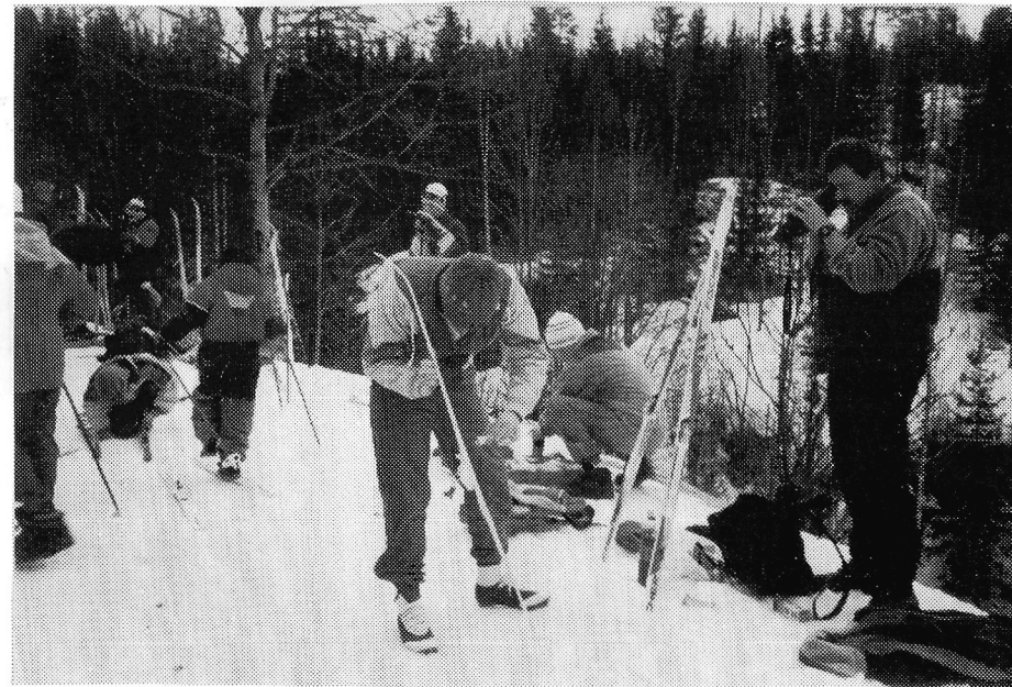
Stor aktivitet før start på årets klubbrenn.

I tillegg til Sjusjøen samlingen forsøker skigruppa å få til en eller to samlinger i Osloomarka hvert år. Noen av gruppene tar helgeturer til hytter foreldre har tilgang på, enten gjennom arbeidsgiver eller privat.