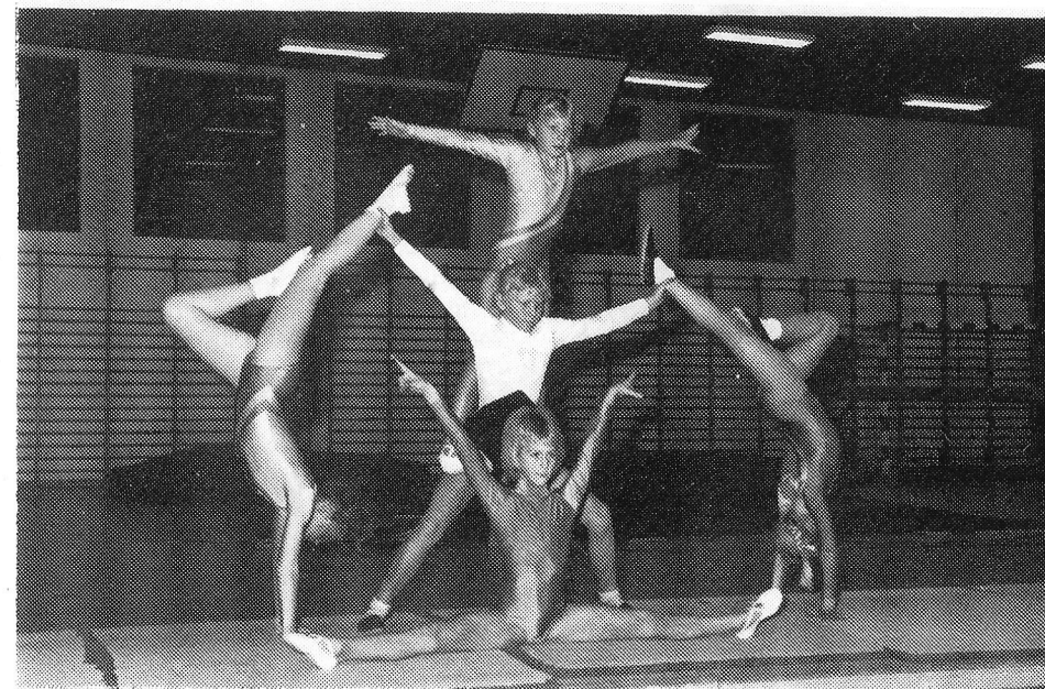
Fra det storeturnshowet i Apalløkkhallen 22. november 1989. Dette fotoet og bildet fra stevnet inne i bladet er tatt av Stein Holmvik.

GREI-NYTT, medlemsblad for Sportsforeningen Grei.