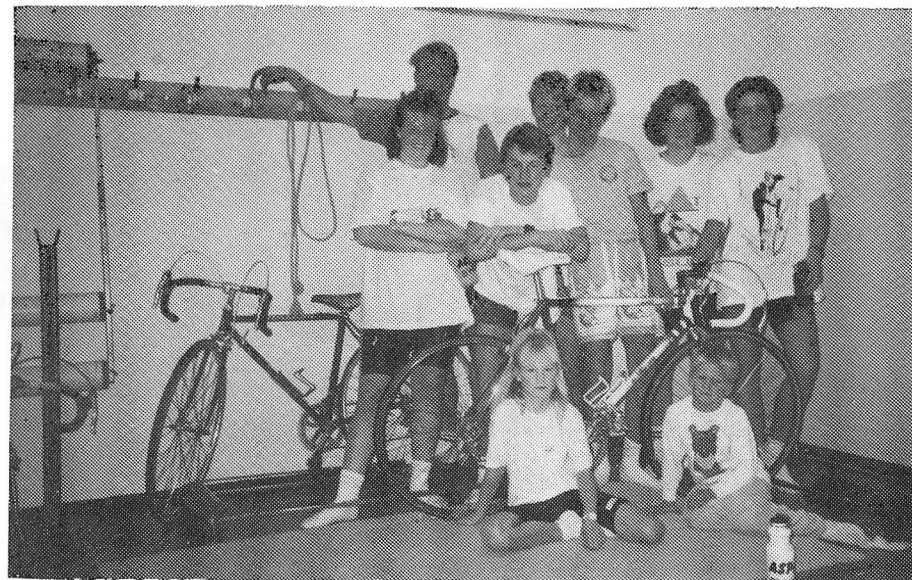
De yngste rytterne, samlet på en trening på Nordtvet skole. De eldste rytterne (junior og senior) etter avsluttet løpetur fra Nordtvet skole.