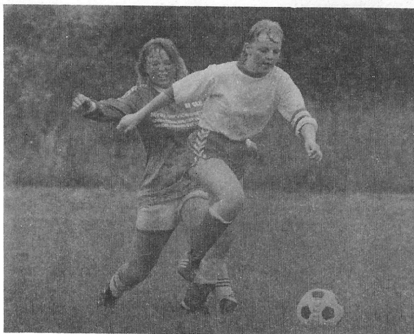
Joda, jentefotballen er i siget.