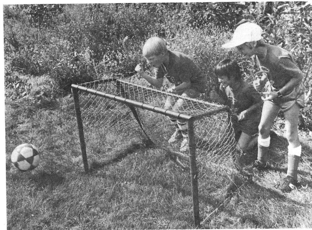
Myggefotball på Grei er gøy !