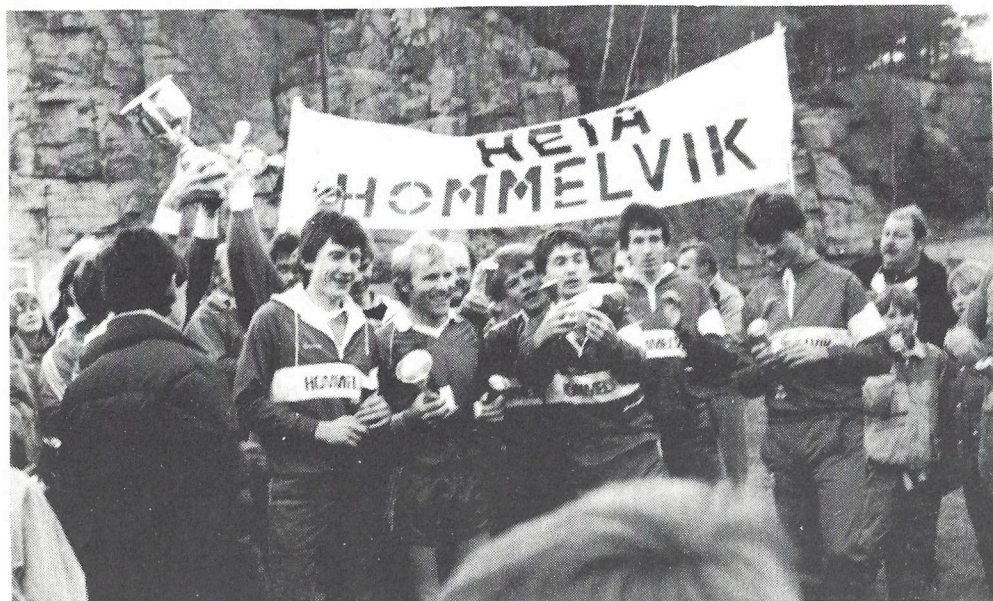
Hommelvik jubler etter finaleseieren over Langangen