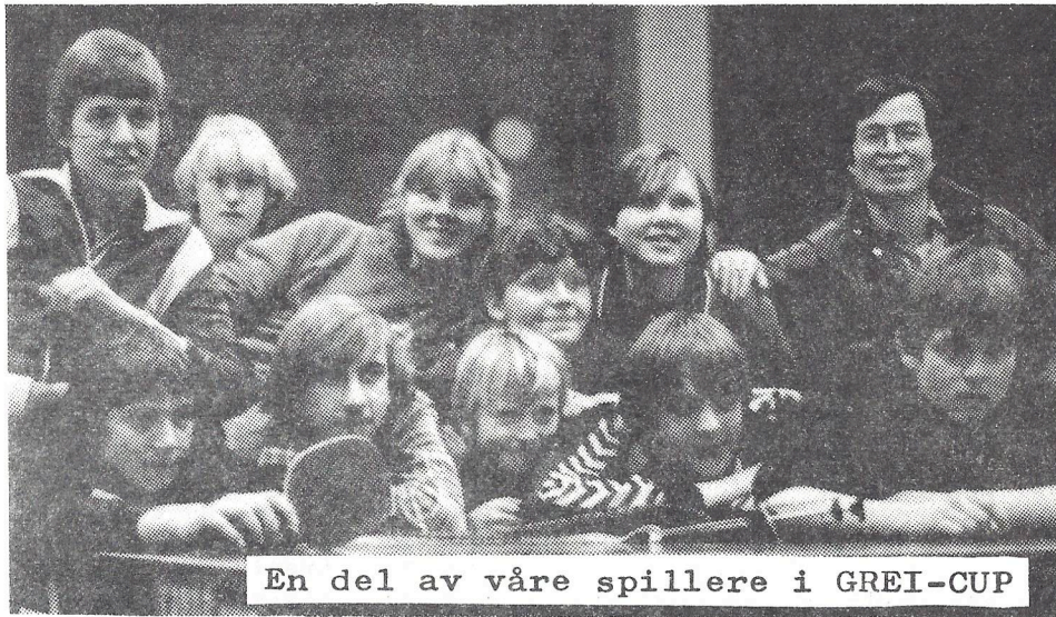
En del av våre spillere i GREI-CUP