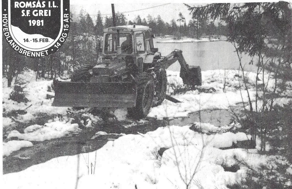
Oslo Skogvesens traktorgraver i full aksjon ved Vesletjern. Stafettutgangen skal v.re her, og god plass kreves, noe tur-folket sikkert har sett følgene av.