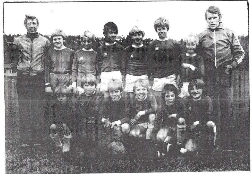
Greis lilleputtlag - hittil ubeseiret i årets seriekamper.

GREI-NYTT. Medlemsblad for Sportsforeningen Grei. Utkommer 4 ganger årlig og sendes gratis til alle medlemmer. Abonnement for ikke-medlemmer: Kr.8.- pr. år.