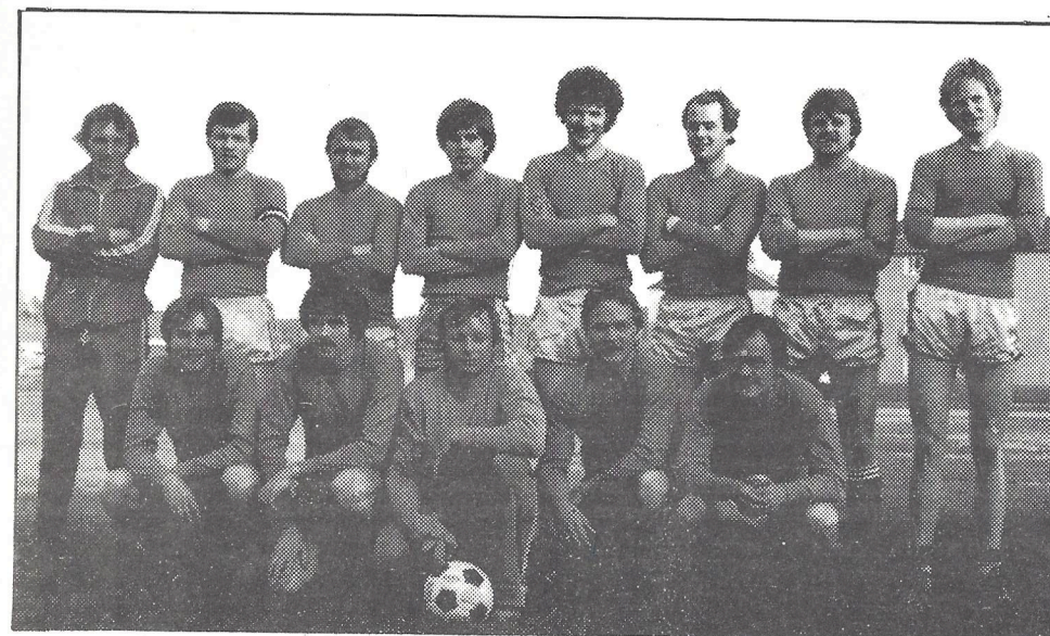
GREIS B-LAG, bare ett tap foreløpig i årets seriekamper.

Et av sesongens høydepunkter for småguttlaget er en åtte dagers tur til Vest-Tyskland og Nederland. Den vil helt sikkert gjøre sitt til at laget får en fin høstsesong.