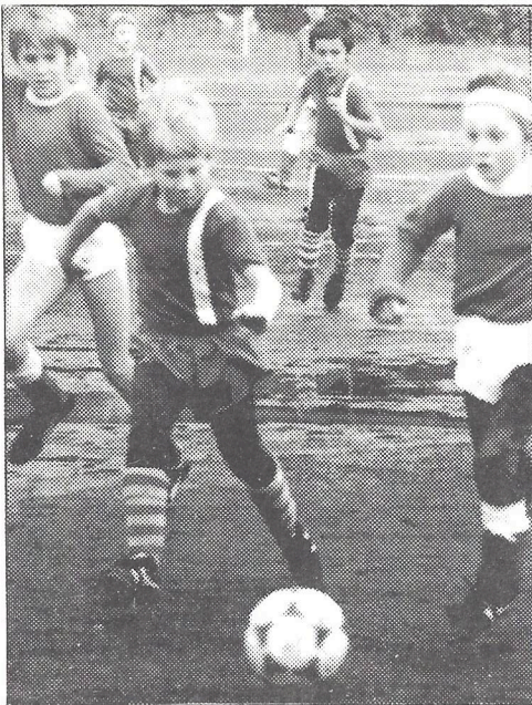
MINI-MYGGER i aksjon på Greibanen - blir det mål?