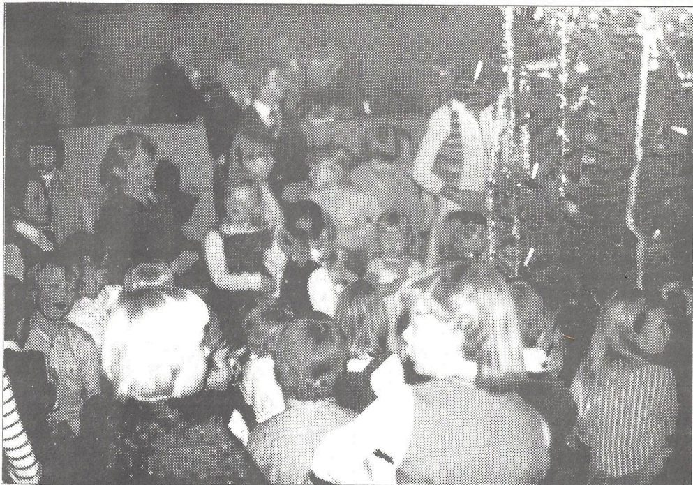
Første juletreffest på flere år - VELLYKKET!