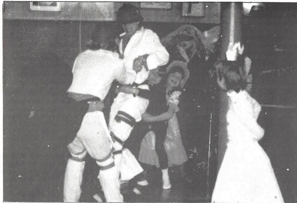
KARNEVAL i turngruppa!