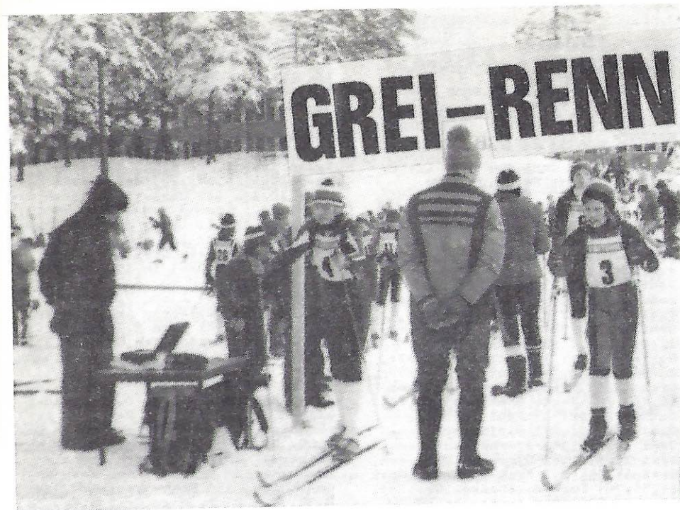
Fra starten under Greif-rennet 23. januar. Å være funksjoner denne dagen var en kald jobb - det var nok kaldt å være deltager også!