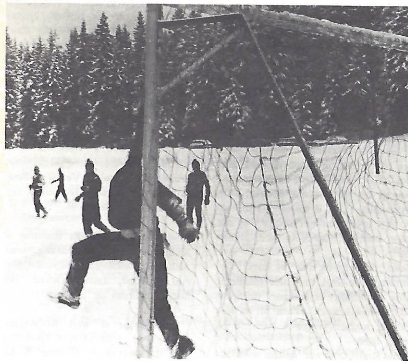
Greis femte mål i treningskampen mot Gjelleråsen.

Grei stilte med 17-18 spillere, slik at flest mulig skulle få prøvd seg.